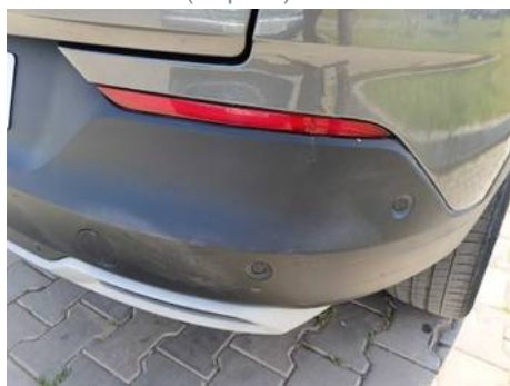
Bouclier arrière (Impact)